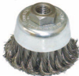
I00620 ALAMBRE TRENZADO

Aplicación: para cepillado en superficies metálicas planas y/o anguladas y para trabajos pesados. Para acabados rústicos en madera, etc.